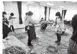
▲昨年の講習会の様子