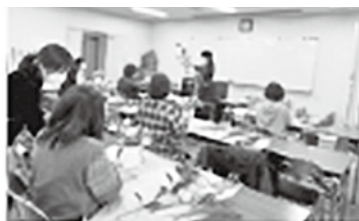
▲個性的な作品が出来上がりました