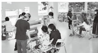
※スタッフの方が、1台につき1人ついていただけるので、安心です