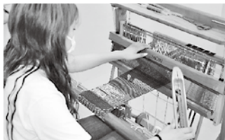
※機械とは違う 手織りならではの温もり irregularな面白さのある SAORI

毎年大好評の「さをり織り体験講習会」。今年も午前・午後の2回開催いたします!! 好きな色を自由に選んで、世界にひとつだけの夏用マフラーを織ってみませんか? アートとして感性のおもむくままに、自分好みに!綿100%の糸を使用するため、 使い心地は抜群です。一緒に、楽しく、さをり織り体験してみませんか?