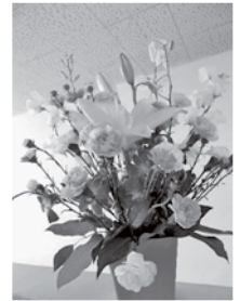
※先生の教室の様子(アレンジのデザインは異なります)

※講習を受けずに花材だけをお持ち帰りいただくことはできませんのでご了承ください。