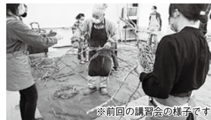
※前回の講習会の様子です

受付期間 10月4日(月)~10月15日(金)17:00まで 《抽選》 電話・FAX・HPで受付