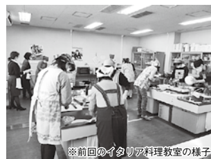
※前回のイタリア料理教室の様子