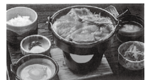
牛鍋定食(肩コース)～イメージ～