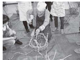
※前回の講習会の様子です